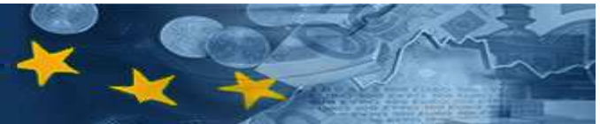
Schéma technickej pomoci