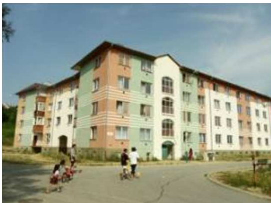
Prešov, sídlisko Stará Tehelňa, 176 nájomných bytov